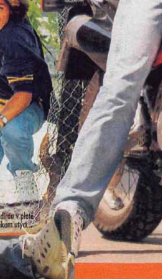
Každou díru v plotě se dá nějak utyt