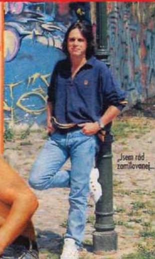
„Jsem rád zamilovanéj...“