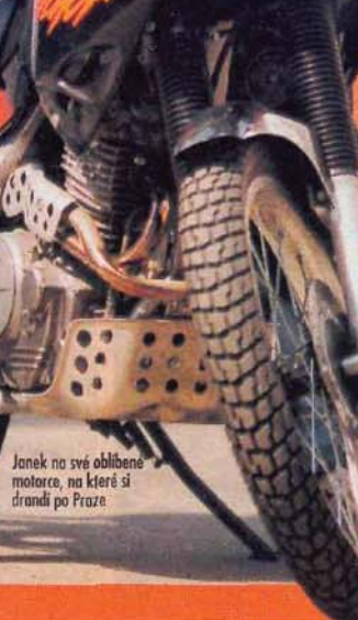
Janek na své oblíbené motorce, na které si drandí po Praze