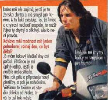
Líběj se mu chytří pro humor