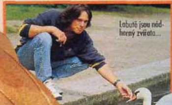
„Ladutě jsou nádherný zvířata...“